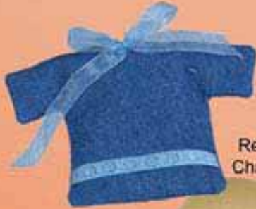
Ref. D143/01009 Chaqueta vaquera