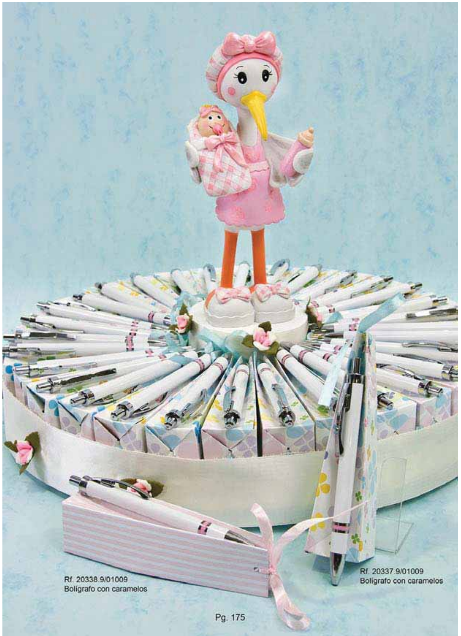
Rf. 20338.9/01009 Boligrafo con caramelos