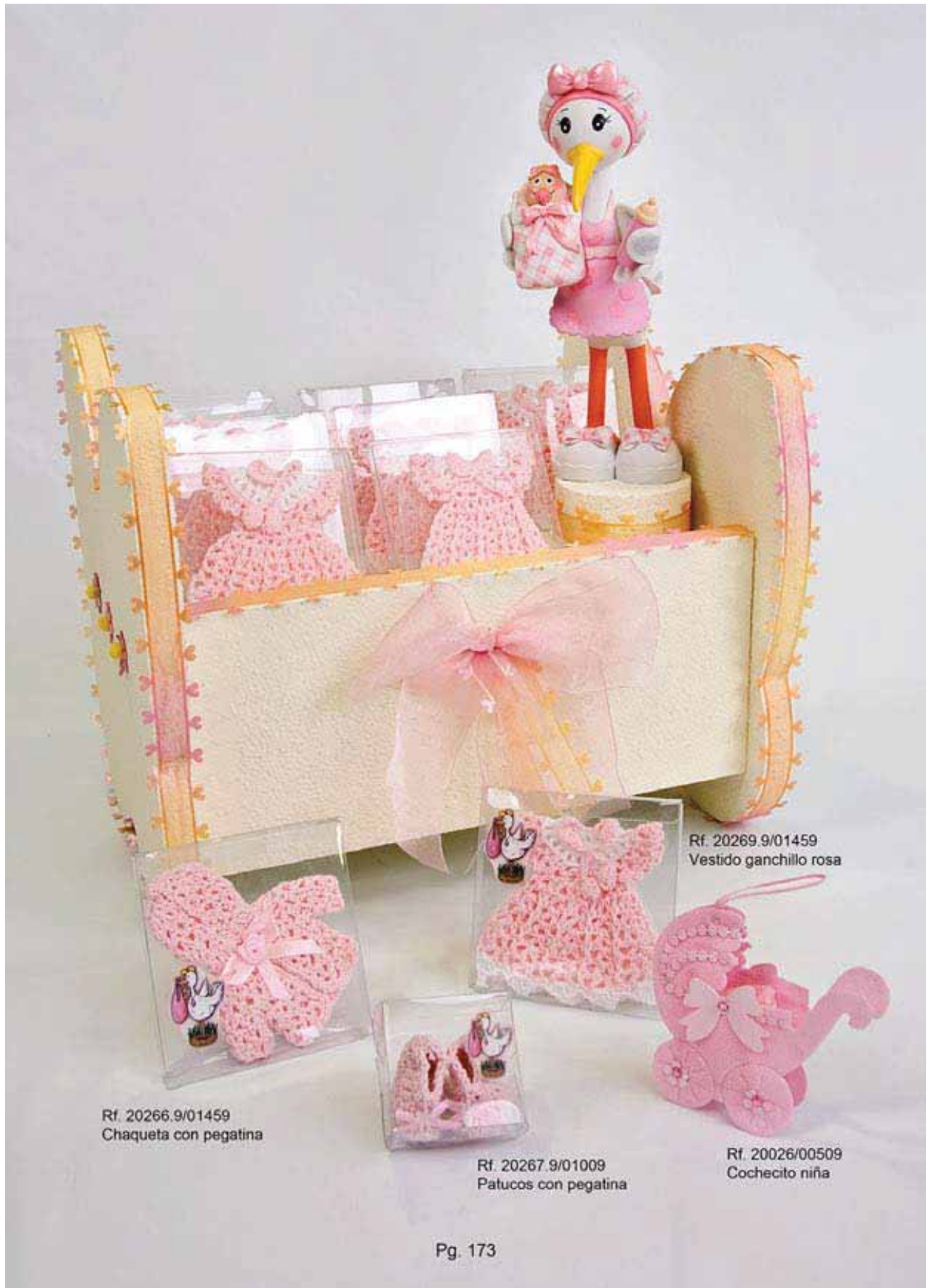
Rf. 20266.9/01459 Chaqueta con pegatina