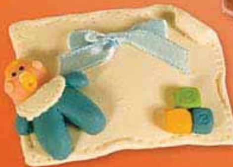
Ref. R250/01009 Iman pasta fimo