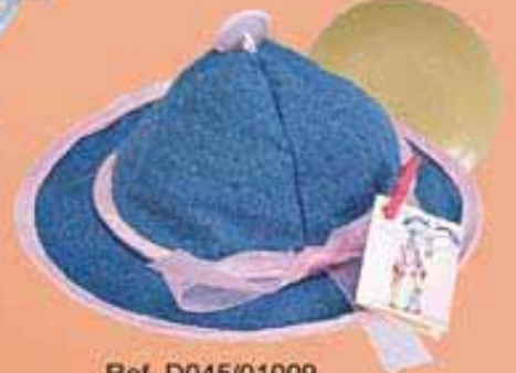
Ref. D045/01009 Gorra vaquera (Contienen jabón)