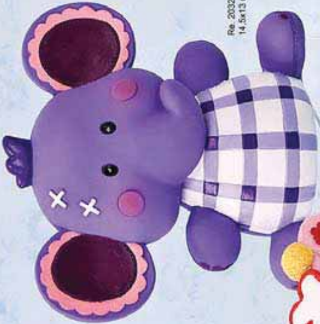
Re. 20323/06409 14,5x13 ctm