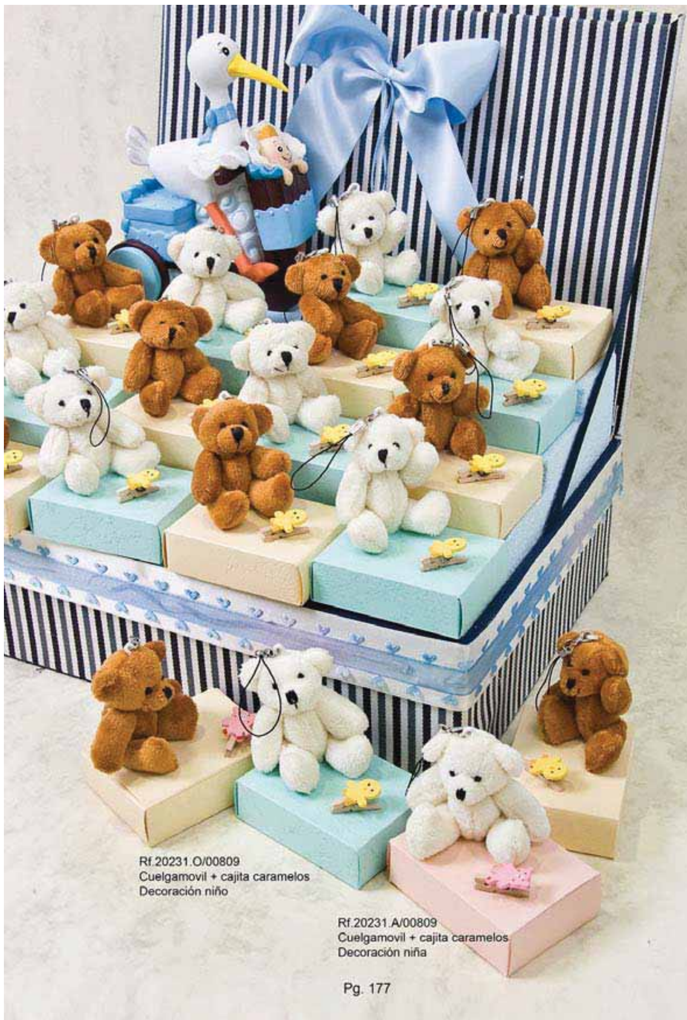
Rf.20231.O/00809 Cuelgamovil + cajita caramelos Decoración niño