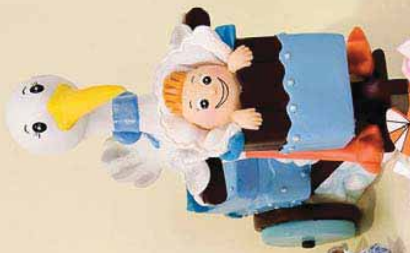
Rf. 20243 A/00659 Broche bebe nifa surtido