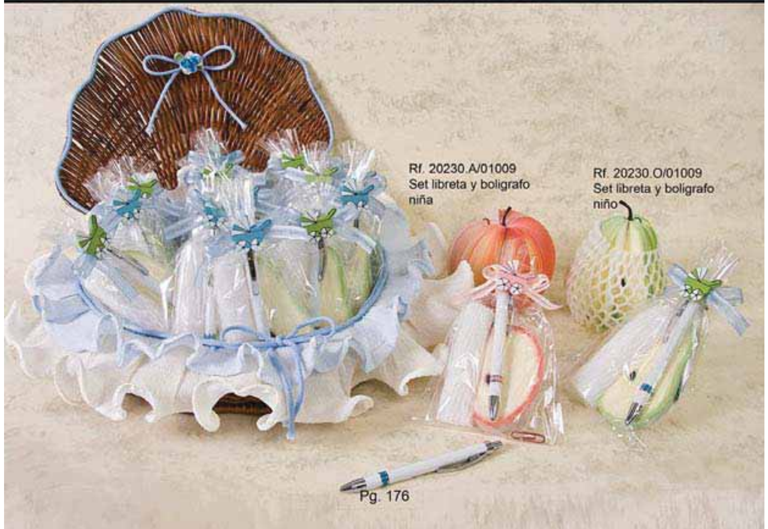
Rf. 20230.A/01009 Set libreta y bolígrafo niña