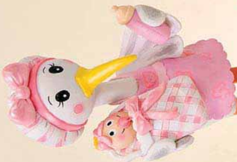
Rf. 20242 A/00659 Broche bebe nifa surtido