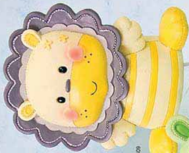
Re. 20324/06409 14,5x13 ctm