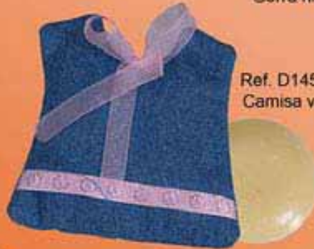
Ref. D145/01009 Camisa vaquera