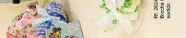
Rf. 20243 O/00659 Broche bebe nifa surtido