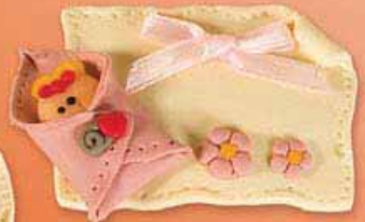
Ref. R251/01009 Iman pasta fimo