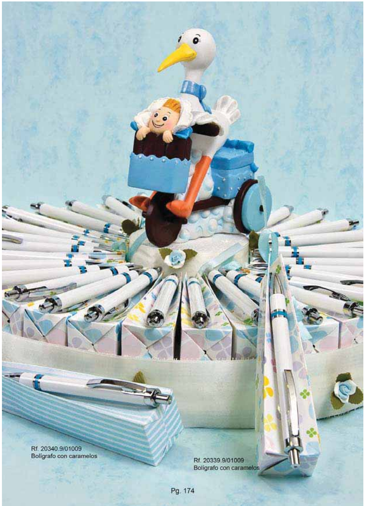
Rf. 20340.9/01009 Bolígrafo con caramelos