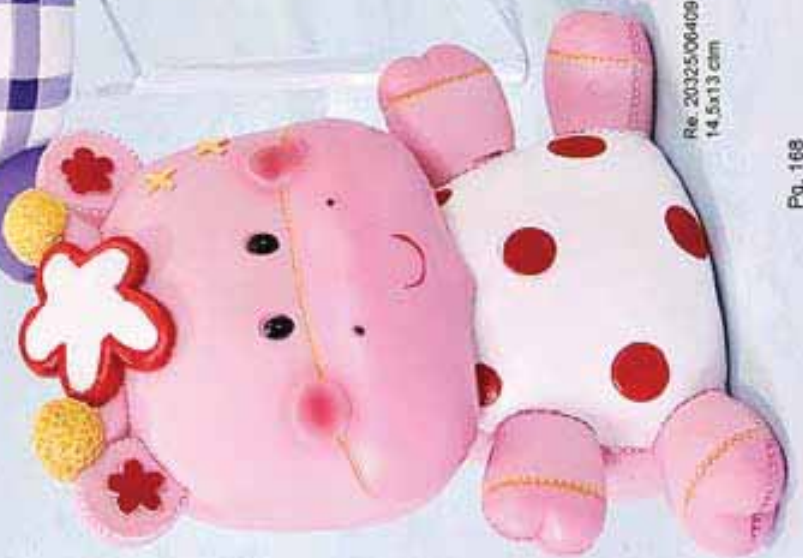
Re. 20325/06409 14,5x13 ctm