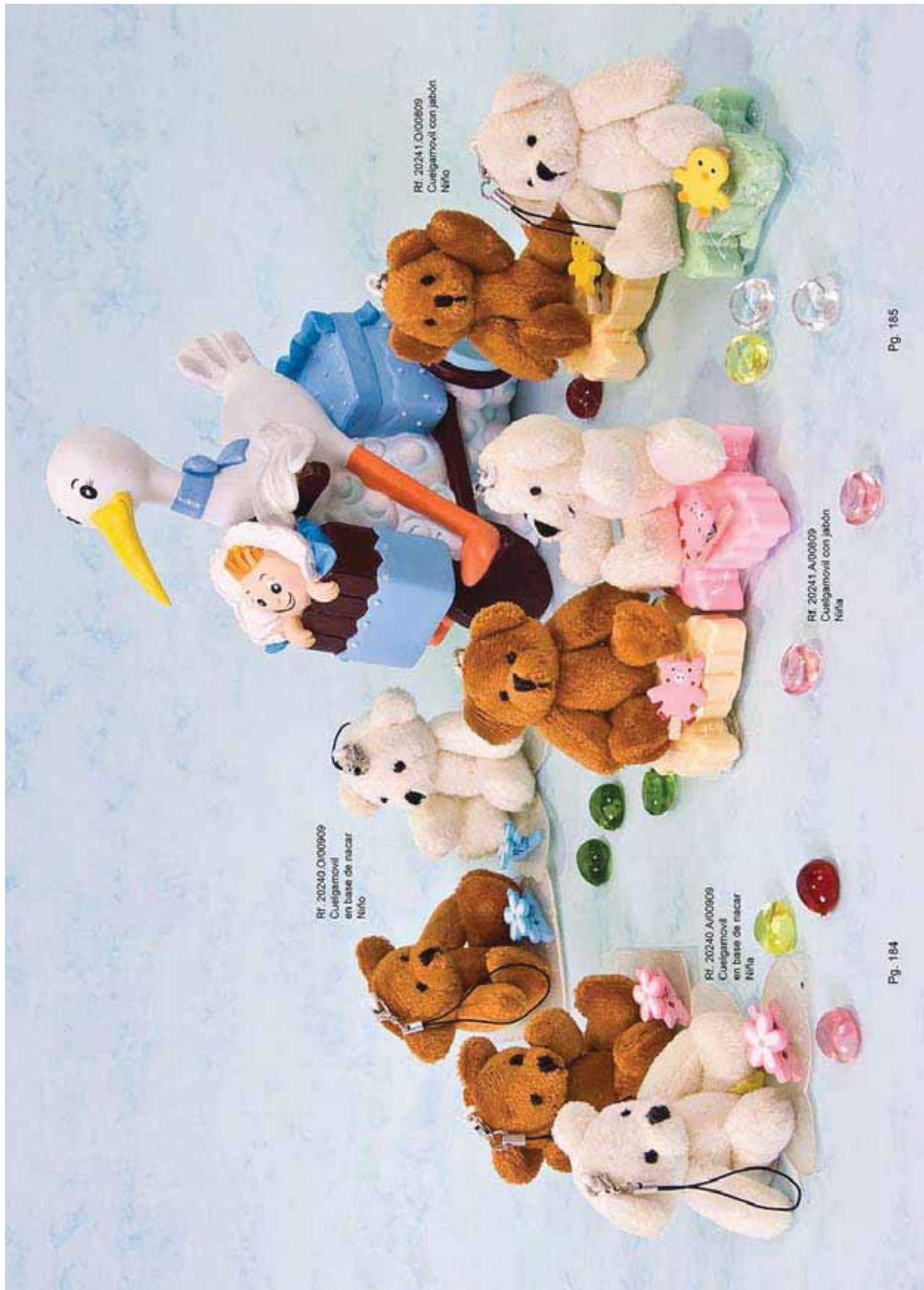
Rf. 20240.OI00909 Cuelgamovil en base de nacar Niño