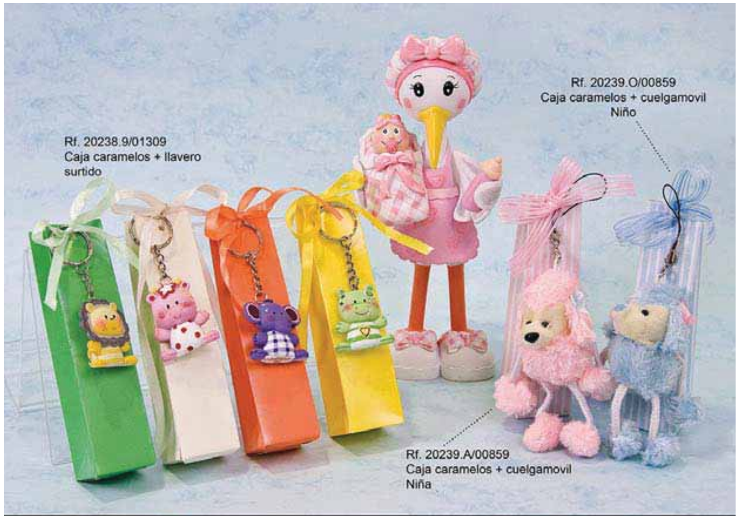
Rf. 20238.9/01309 Caja caramelos + llavero surtido