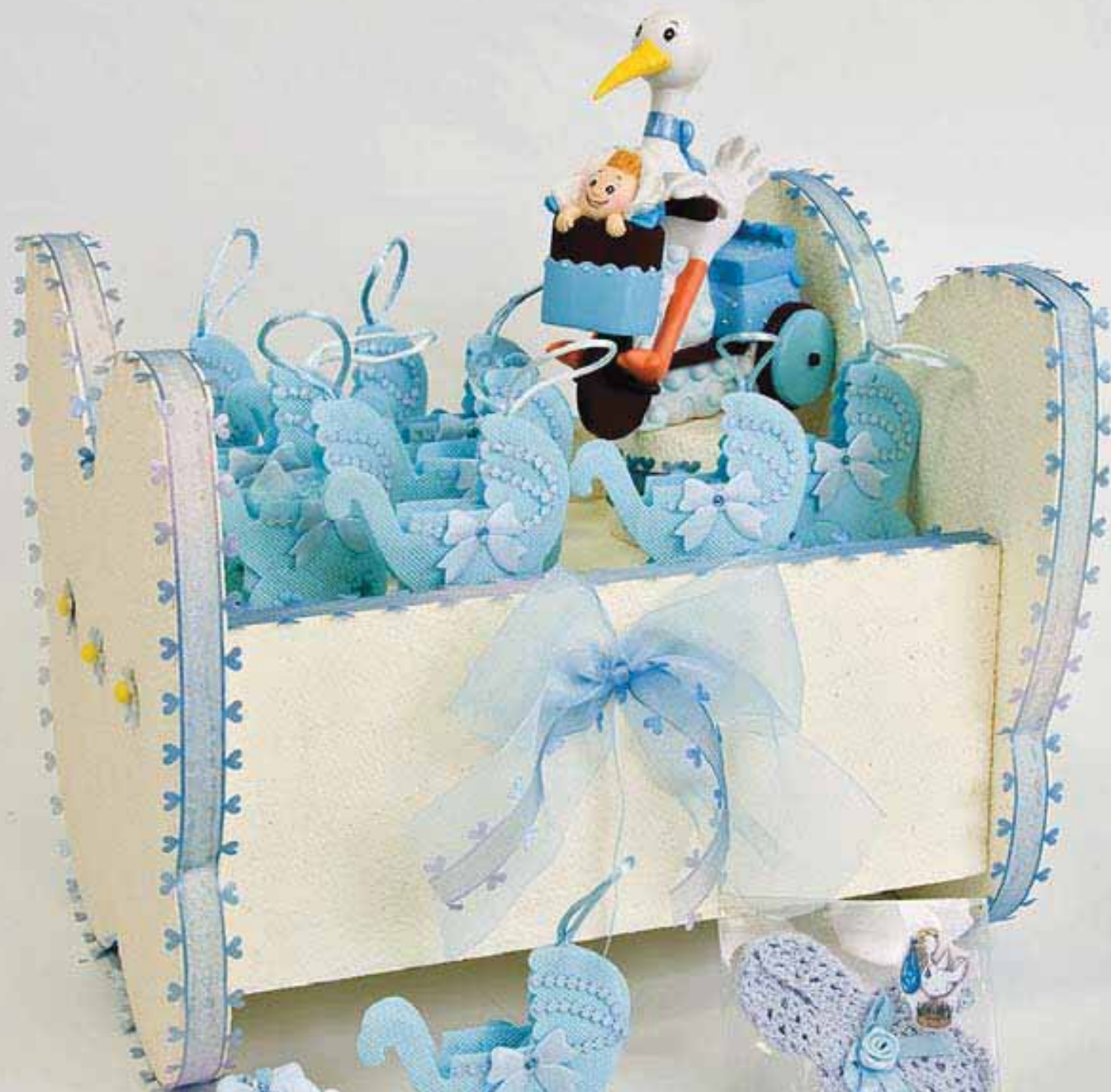
Rf. 20028/00509 Babero bebé