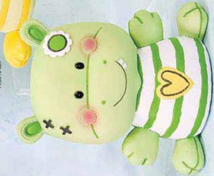
Re. 20326/06409 14,5x13 ctm