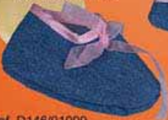
Ref. D146/01009 Patuco vaquero