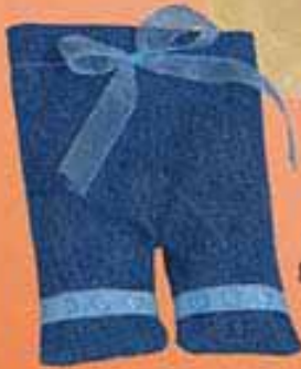
Ref. D144/01009 Pantalón vaquero