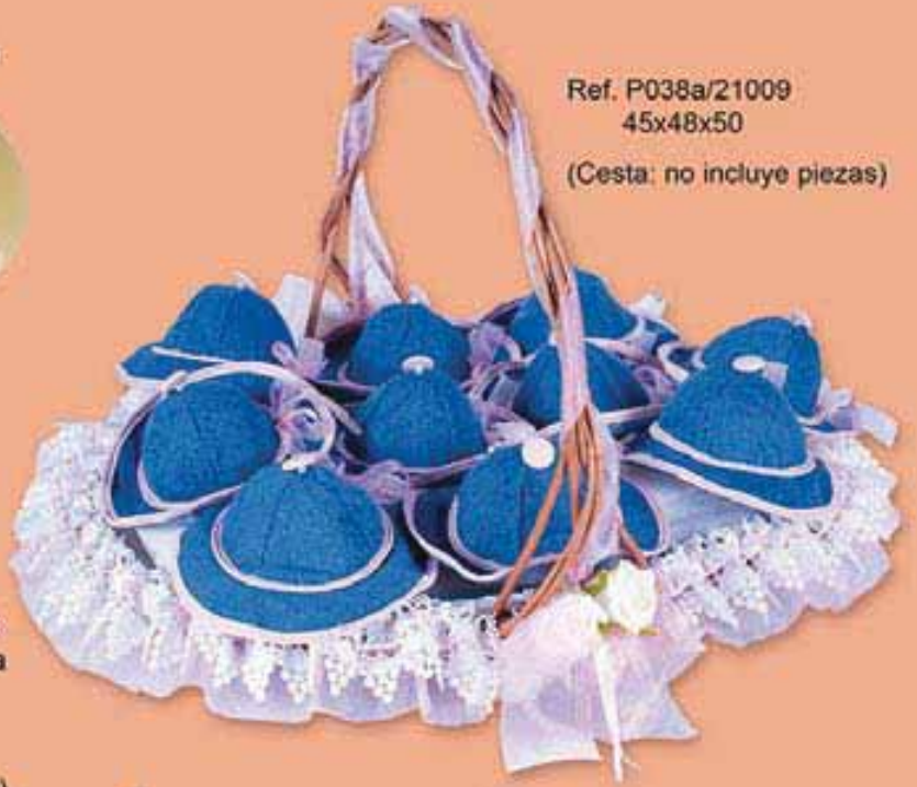
Ref. P038a/21009 45x48x50