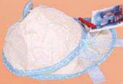
Ref. D044/01009 Gorra niño